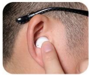
4. Adjusting the volume