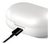
2. Fully charged