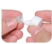
1. Earbud selection

When you wear it for the first time, please fully charge your hearing aid, when charging The middle indicator light is red